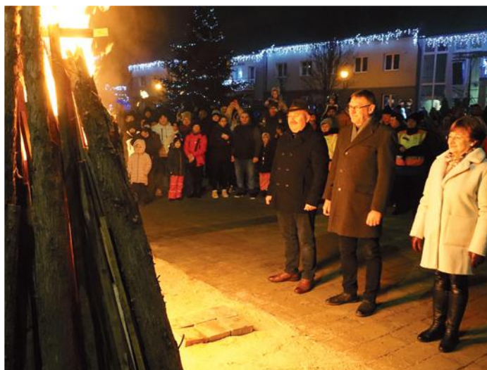
Boldog új évet, Polgár!