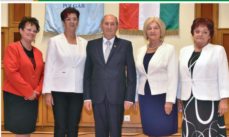
Humánfeladatok és ügyrendi bizottság