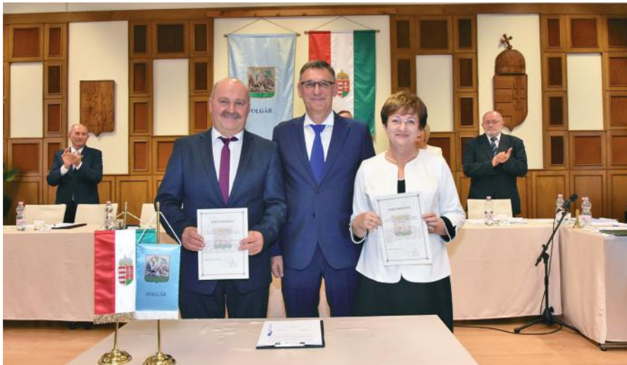
A város vezetői