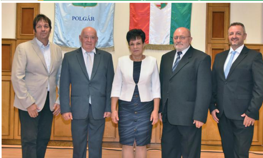
Pénzügyi és gazdasági bizottság