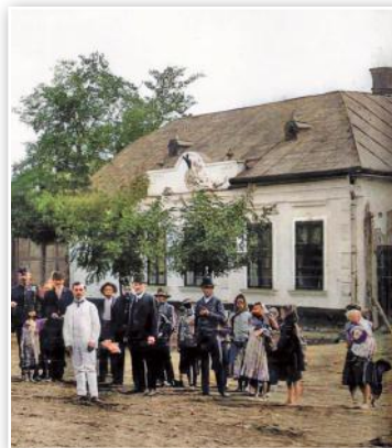
Csendőrlaktanya az 1900-as évek elején