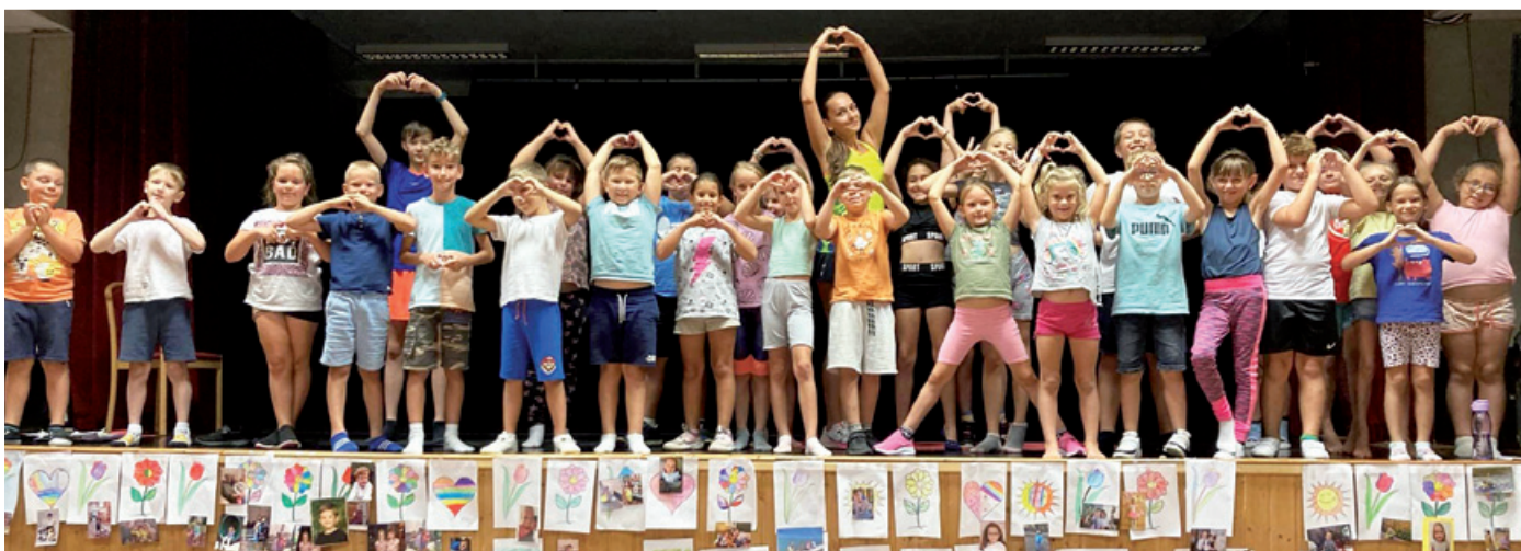
Tábori élmények - élménytáborok az Adyban