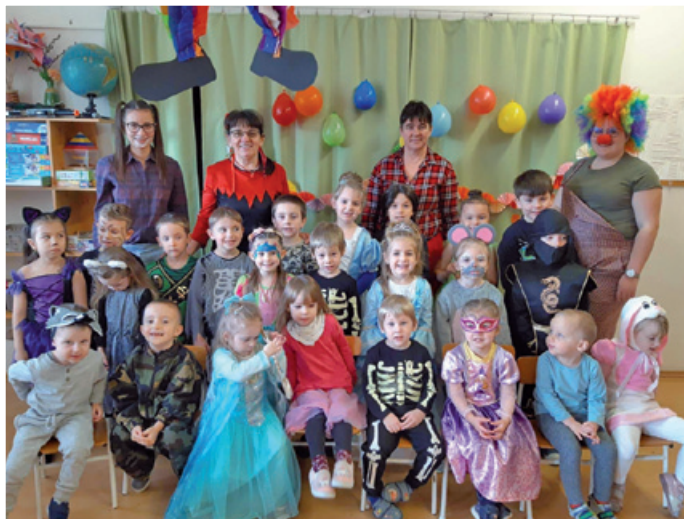
Télűzés az oviban