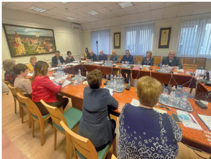
Döntött a 2023. évi költségvetésről a Képviselő-testület