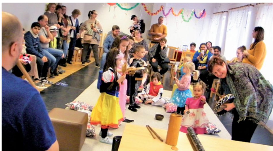
Farsangi családi játszóház