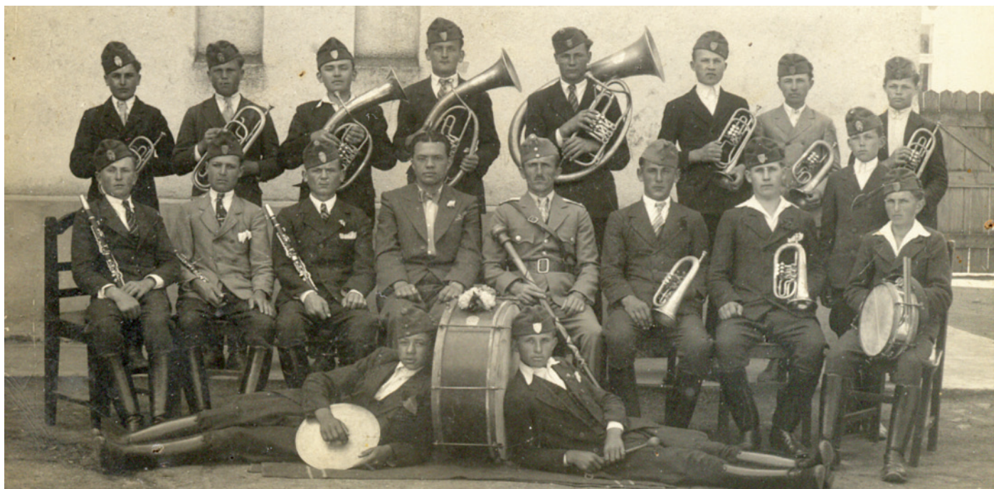
Polgári levente zenekar

Részlet Megyesi József: Polgár város múltja és jelene (2013) című könyvéből