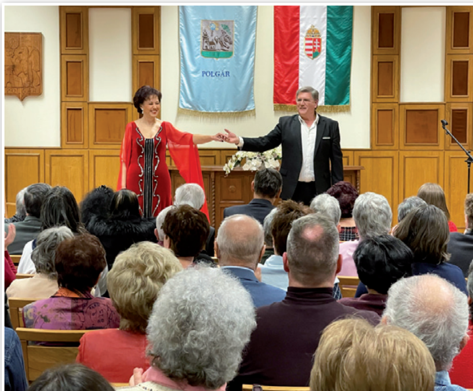
Magyar Kultúra Napja