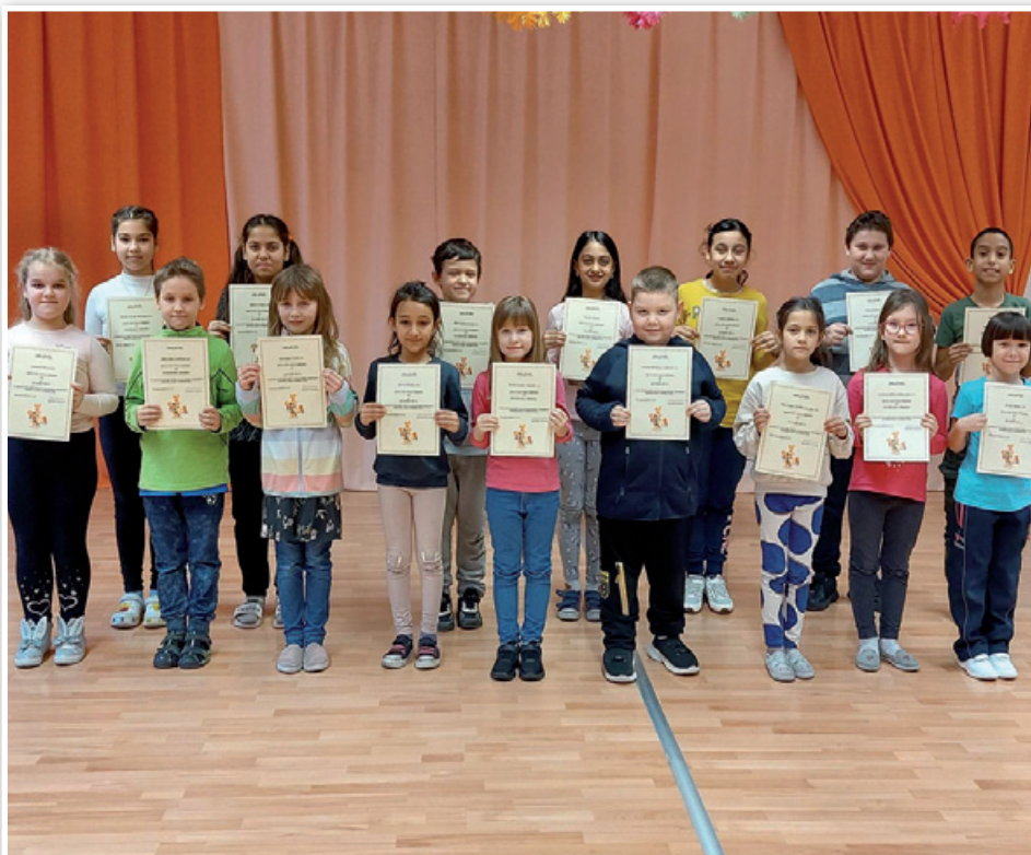
Szépolvásó- és versmondó verseny díjazottjai