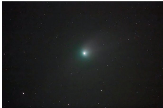
Üstökös Polgár felett

a Vega Csillagászati Egyesület közlése nyomán