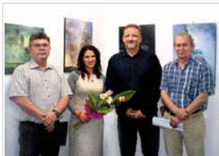
Arany Gusztáv festménykiállítása