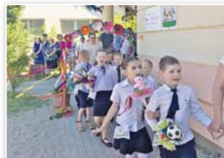
Elballagtak a nagycsoportos óvodások