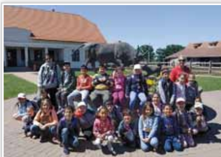
Kirándulás a hajdúnánási biofarmra

2022. JÚNIUS XXXII. évfolyam 6. szám (354.)