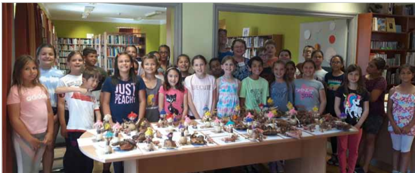
Jutalomdélelőtt a könyvtárban