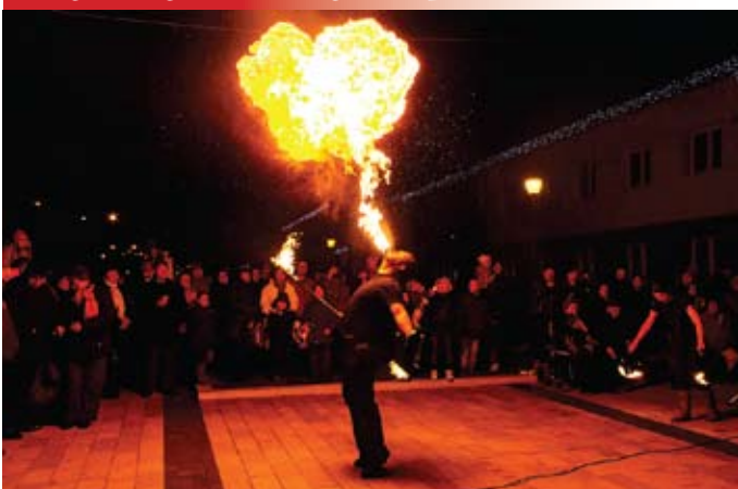
Lángoló Csigák - Tűzsonglór Csapat