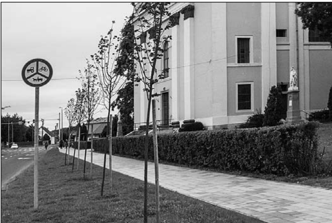
Az új járda és fasor