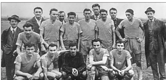
1964-65 - polgári focicsapat