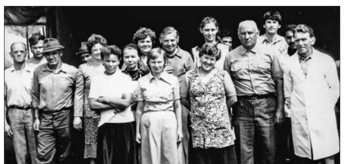
1973 Pékség dolgozói