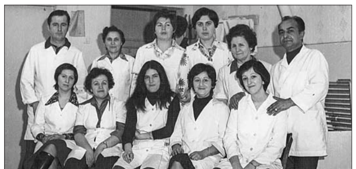
1970-es évek Fodrászat