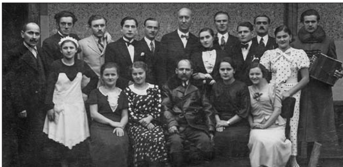
1930 körül - Ipartestületi színjátszókor