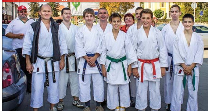
Fuku-do Sportegyesület 10. oldal