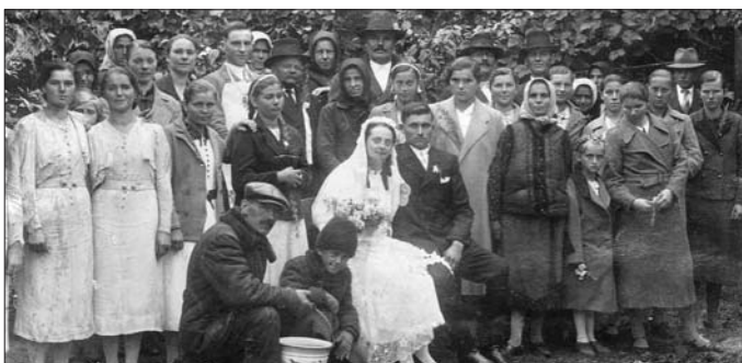
1930 körül Eskivő