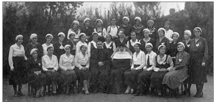
1930 körül Mária kongregáció