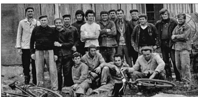
1970-es évek Társadalmi munka az épülő strandfürdőnél