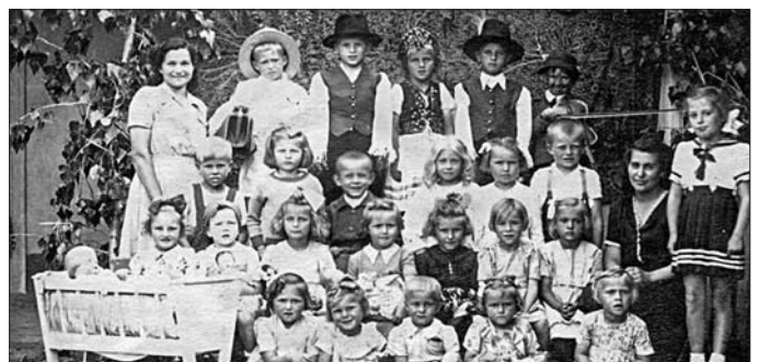
1940-es évek óvodás csoport