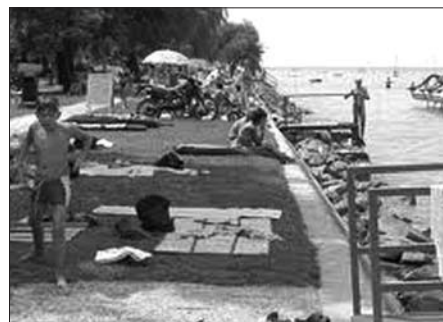
Az üdüllő üzemeltetése a Városgondnokságnál maradt

A nemzeti vagyonról szóló törvény értelmében az