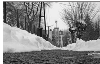
A járdák hamar járhatóvá váltak

- Felkészülten vártuk a havazást, hiszen az előrejelzések, a hírek időben szóltak a várható következményekről. Az már szinte menetrendszerű, hogy a rossz idő, a havazás általában hétfvégén, vagy ünnepnapon érkezik. De azt kell mondjam, nálunk koránt sem volt olyan mértékű a havazás, mint a Dunántúlon, vagy az ország középső részén. Azt gondolom, hogy a rendelkezésünkre álló gépekkel, eszközökkel meg tudunk birkózni a helyzettel. Minden gépünk ki lett vezényelve a városba, a tolólapos traktorunk, a JCB, és a munkagépünk, amely komplex feladatokat - hótolás és sózás - képes ellátni, továbbá kézi erőt