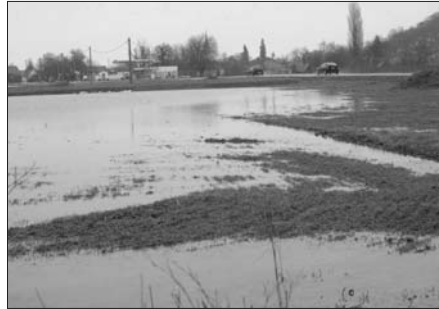
Másodfokú a készültség

a hozzájuk tartozó felügyelőségekre felosztott területekért felelős úgynevezett felügyelők, valamint a gát- és csatornaőrök összehangolt tevékenysége által.