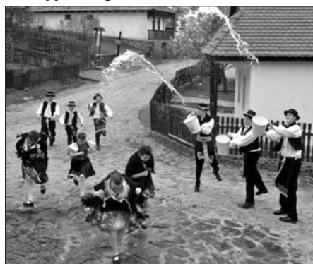
Húsvéti életkép Hollókőn

csolni, és hogyha azt mondták, hogy szabad, akkor a kis verset el kellett mondani.