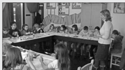
Szorgos kezek alkotnak