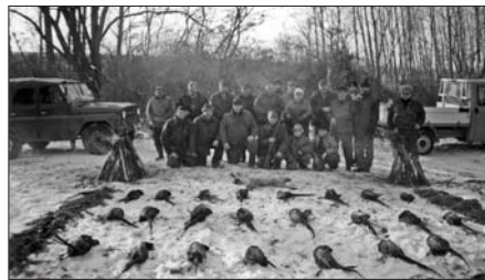
Területen az apróvad

- A vaddisznóra jelenleg nincs korlátozás, eddig más vadállománynál vadászati idények vannak megállapítva, apróvadfajok idénye zömében a téli időszak. Nyár végén a vízi vaddal, kacsával, szárcsával indul a vadász szezon, majd októberben kezdődik a fácán vadászata, novembertől a nyúl, és ezek január végéig tartanak. Az őz, őzbak vadászata áprilisban kezdődik és szeptember végéig tart, október elsején pedig a suta illetve a gida vadászata kezdődik. Említettem, hogy dám is van a területünkön, azt óvjuk és védjük, mivel ez az állat az egyik legkevésbé mezőgazdasági kárt okozza, ezért szeretnénk, hogyha kicsit felszaporodna a területünkön. Az okból is, mert