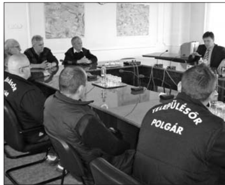
A közbiztonsági tanácskozásonk rendszerese

kal csökkent az ismertté vált bűncselekmények száma – illetve a lakosság szubjektív biztonságérzete szolgáltak, – ez utóbbi koránt sincs összhangban a beszámolóban olvashatókkal – hangzott el az ülésen. A képviselők sorra tették fel kérdéseiket, foglalmazták meg saját, illetve a lakosok által tolmácsolat véleményeiket, melyekre az őrsparancsnok és a kapitány felváltva adták meg a válaszokat. A vita végén Tóth József polgármester mintegy összegzésként elmondta; az önkormányzat igyekszik mindent megtenni a közrend, közbiztonság fenntartásáért, javításáért, ennek érdeké-