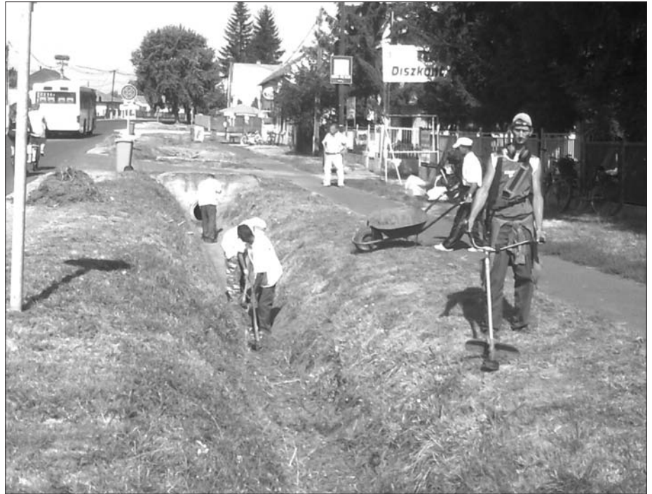
Munkában a fűkasza

- A program belterületi rendezésére vonatkozó része november 30-ával zárul, míg a külterületi december 31-ével ér véget. A program keretében tervezett gépbeszerzés egy kicsit megcsúszott, a közbeszerzés miatt az eszközök néhány hónappal később, csak júliusban illetve augusztusban érkeztek meg. A belterületi programban egy használt, JCB munkagépet vásároltunk, ami nagyban segítette az utak karbantartását. Elsősorban padkarendezést végeztünk vele, az árokmedernek és az árokpartoknak a tisztítása, takarítása kézimunkával folyt. A külterületi programon belül egy MTZ traktort illetve egy vontatható grédert vásároltunk, amivel a külterületi földutak karbantartását, a padkákat úgy tudjuk rendezni, hogy azok közlekedésre alkalmasak legyenek mind a mezőgazdasági vállalkozók, mind a személykocsival közlekedők