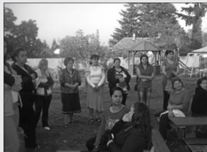
A Móra úti óvoda nevelőközössége nevében

„Isten tartsa meg a szokásunkat!”, „Ilyen finomat még nem ettem!” (Hogyan kell csírát csinálni?)