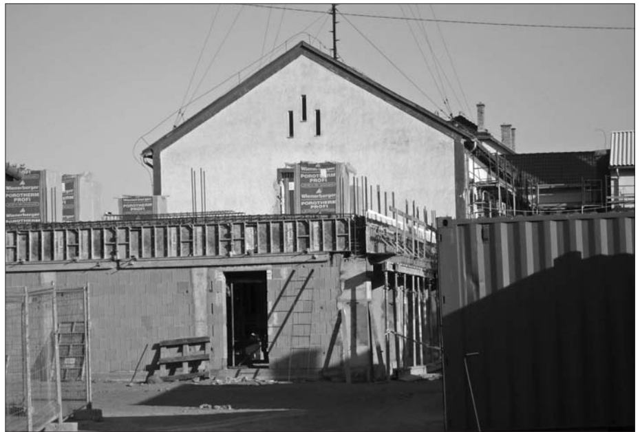
Terv szerint zajlik a beruházás

De, kérdezzen, mert tervek és célok, azok bőven vannak. Egy tudatos városfejlesztési stratégia mentén tesszük a dolgunkat, még akkor is, ha gyakran rajtunk kívül álló körülmények miatt, akár tartalmában, akár a megvalósítás időbeni ütemezésében változ-