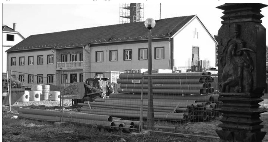
“Egy ablak” a Kormányé lesz

- Mi nem tervezzük létszámleépítést. Az, hogy minden feladatnak meg lesz a z ügyintézője, ezt majd akkor tudjuk, ha január 1-jén már biztosan látjuk a hatályos jogszabályokat. Rajtunk nem múlik, az biztos, ha csak a külső, kényszerítő jogi feltételek nem úgy alakulnak, hogy bárkitől is meg kelljen válnunk. Az új feladatfinanszírozási rendszerben még nem tudjuk, hogy mennyi lesz a 2013. év költségvetési forrása.