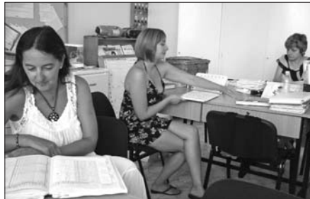
Papír helyett elektronika

rel kattintva kiválasztani a megfelelő érdemjegyet. Ami érdekes volt - hiszen azonnal rögzítődik a hiányzás - hogy egy szakiskolai osztályban is bevezettem a digitális adatrögzítést, és megszűnt a hiányzás, onnantól kezdve a gyerekek egyszerűen nem hiányoztak.