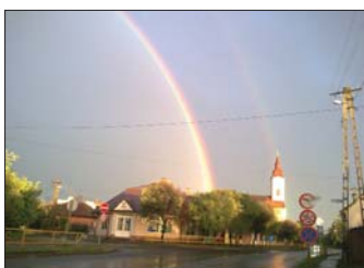
Vitos Róbertné: Szivárvány Polgár fölött