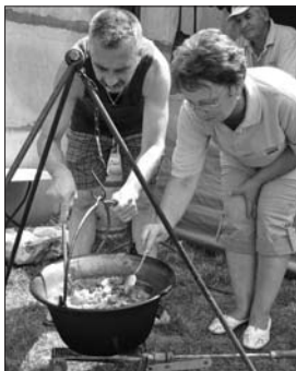
Egy kondérban keverünk

A versengés egyik részét képezte csak a foci, a másik megmérettetés a csapatokat kísérő „hadtáposokra” várt, hiszen a szervezők főzőversenyt is hirdettek a résztvevőknek. A kánikulai melegben igen látványos, de már-már vízízpóló számba menő mérkőzéseket játszottak a csapatok. A polgáriak kemény ellenfélnek bizonyultak - amit a végeredmény is igazol – de persze senki sem adta „olcsón” a bőrt. A 10 perces menetek során mindenki mindenkivel megmérkőzött, a helyezések sorrendjét pedig a pontszámok, az egymás elleni eredmény, a gólkülönbség és a több rúgott gól alap-