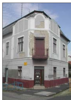
Nábrádi Benedek: Polonkai ház