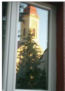
Répasiné Kosza: Lenke- Hivatalok