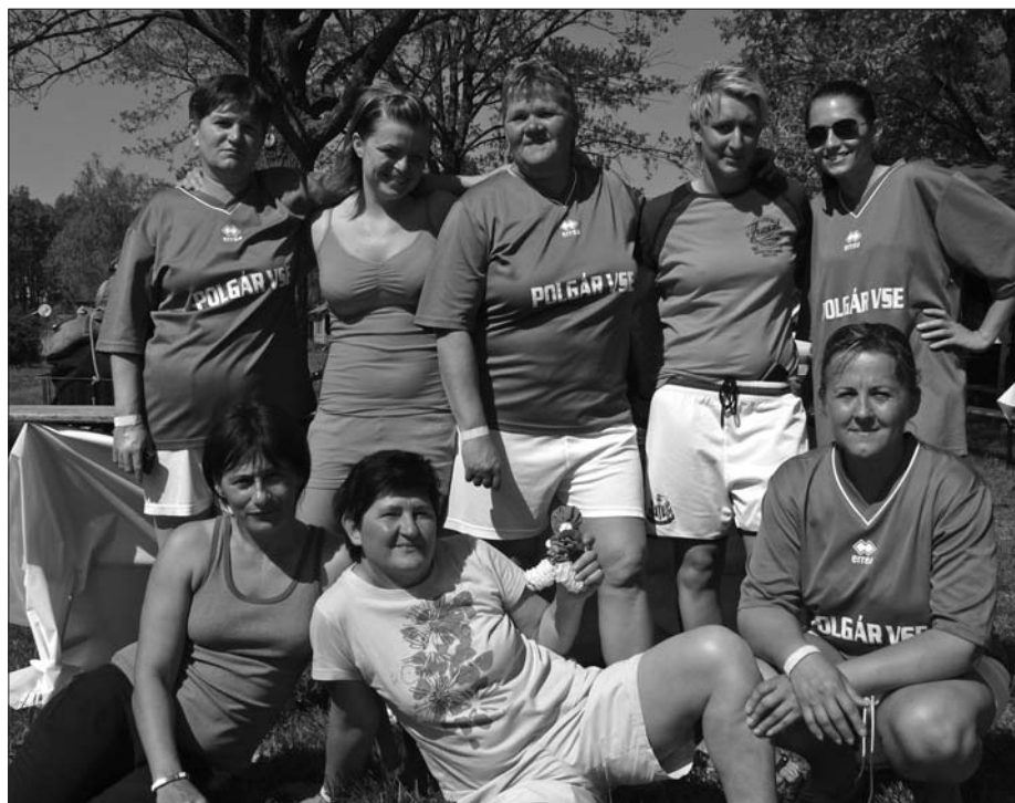
Eredményhirdetés után a polgári hölgycsapat (egy része)

Polgár Város I. Női Labdarúgó Tornájára öt csapat nevezett – elismerés a hőségben is remekül helyt álló hölgyeknek. A bajnokság végeredménye: