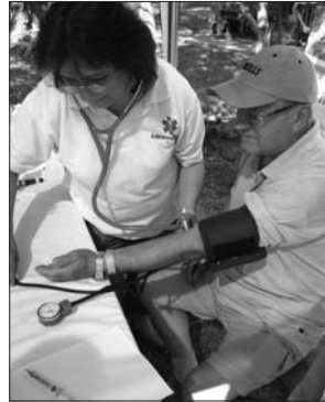
Vérnyomásmérés a majálison

problémával találkoztunk, de mindig voltak jó szándékú, segítőkész emberek, akiknek munkájára számíthatunk, és akik öregbítették a szer-