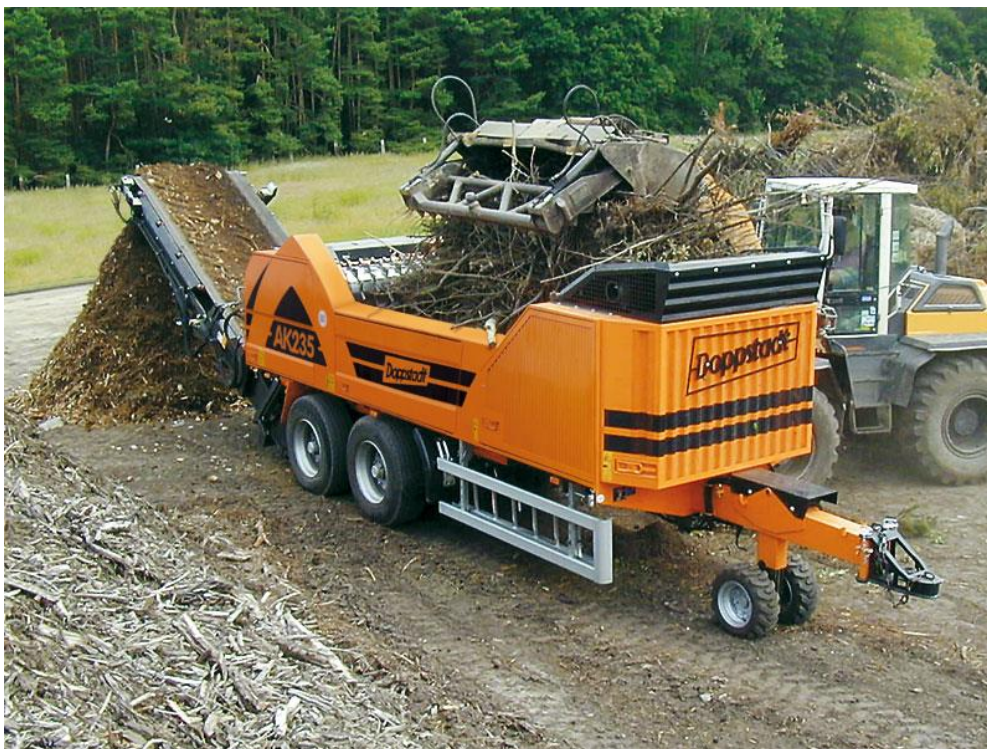
Doppstadt AK 235 zöldhulladék aprító akár mobil egységként is helyszíntre telepíthető.