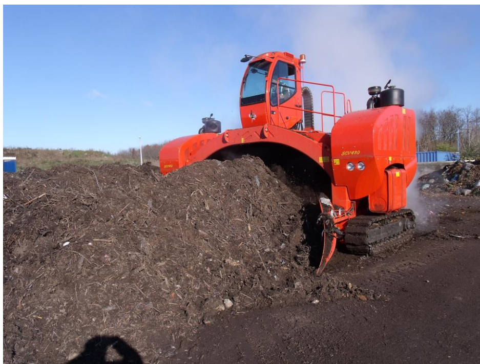
SEKO önjáró komposztforgató munka közben a Regionális Hulladékkezelő Telepen