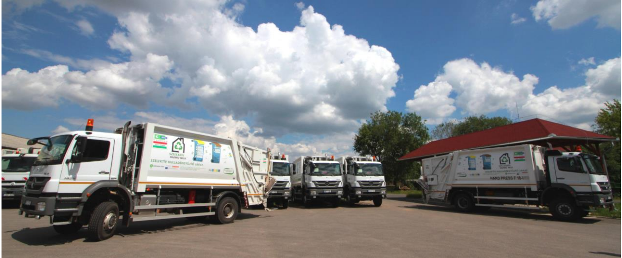
Szelektív gyűjtőjárművek a HHG Nonprofit Kft. telephelyén