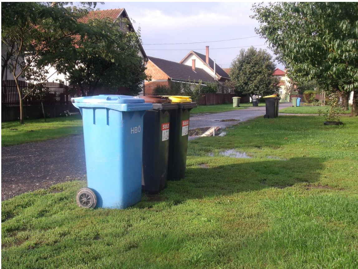
3 gyűjtőedény kihelyezve a gyűjtési napon.