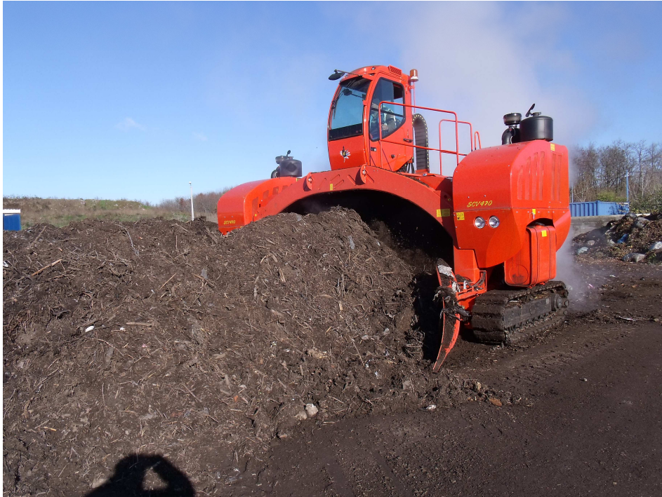
SEKO önjáró komposztforgató munka közben a Regionális Hulladékkezelő Telepen