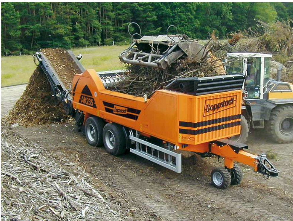
A KEOP projekt keretében beszerzésre került Doppstadt AK 235 zöldhulladék aprító akár mobil egységként is helyszíntre telepíthető.