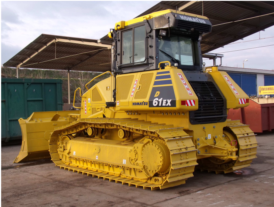
a KEOP projekt keretében beszerzésre került új Komatsu D61 EX dózer a depónia művelését szolgálja.