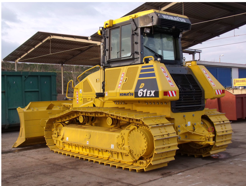
a KEOP projekt keretében beszerzésre került új Komatsu D61 EX dózer a depónia művelését szolgálja.